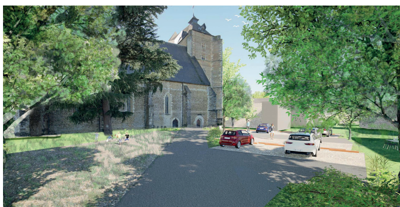
Parking de l'église Saint-Girons : avant / après. Perspective réalisée par Toponymy